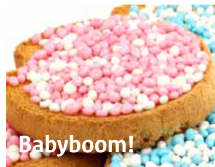
ROSMERSHOLM PROFESSIONAL SERVICES

afgelopen jaren tussen de 5 en 12 mensen met autisme aan het werk zijn geholpen. Mensen die vanwege hun beperking anders niet aan het arbeidsproces deel zouden hebben kunnen nemen en afhankelijk zouden zijn van een WAJONG-uitkering, kregen dankzij Autest een opleiding en een nuttige dagbesteding. Een aantal medewerkers is zelfs in dienst getreden bij opdrachtgevers na een succesvolle opdracht. Ondanks alles een mooi maatschappelijke impact...! <